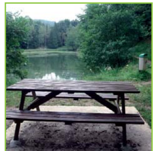
Vue sur la rive gauche et les aménagements réalisés

insister de juin à août car la température des eaux peut être forte à ces périodes. De nombreux arbres et arbustes jonchent le parcours et les branches immergées peuvent elles aussi apporter satisfaction au pêcheur à rôder. Attention toutefois, il y a moins de recul pour lancer car le chemin est plus étroit à cet endroit. Pour finir, vous trouverez au niveau de la retenue en rive gauche une table et une poubelle. N'hésitez donc pas à en faire bon usage.