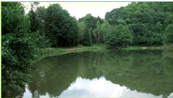
Vue sur la rive droite du lac

Des travaux de restauration ont été entrepris en 2008 : vidange, entretien des rives... Des empoissonnements réguliers de truites sont effectués sur le site par le gestionnaire afin de garantir au pêcheur des moments intenses ! Ce petit plan d'eau est aménagé pour accueillir les pêcheurs et leur famille : sentier, bancs, signalétique... le lieu idéal pour pique niquer tout en s'adonnant aux plaisirs de la pêche ! Enfin, ce site a été également conçu pour accueillir les personnes à mobilité réduite puisque des aménagements garantissant l'accessibilité ont été réalisés : stationnement, sentier, ponton labellisé "tourisme et handicap".