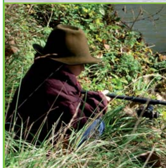
Jeune pêcheur sur les rives du lac

En rive droite du plan d'eau , une jolie avancée permet de prospecter directement la queue du lac, tout en restant dissimulé par la végétation. En période, de fortes eaux, la queue du lac est à prospecter en priorité. En effet, l'arrivée d'eau par le ruisseau vient apporter pléthore de nourriture et les poissons s'y rassemblent volontiers.