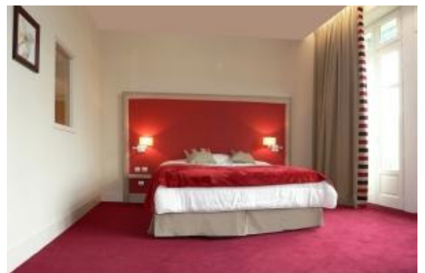
Week-end de charme A l'hôtel du Parc