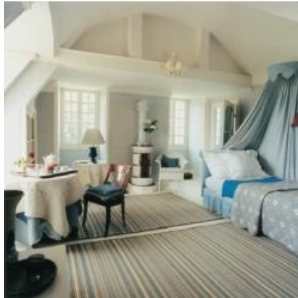
Week-end de charme en Béarn Pays Basque; votre chambre romantique

Office de Tourisme du Béarn des gaves rue des Bains 64270 SALIES-DE-BEARN Tel : 05.59.38.32.82 - Fax : 05.59.38.02.95 / resa@tourisme-bearn-gaves.fr