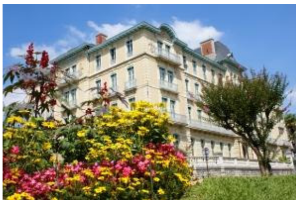
Week-end de charme A l'hôtel du Parc.