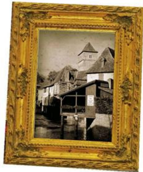
Chasse aux trésors à Salies en Béarn des gaves