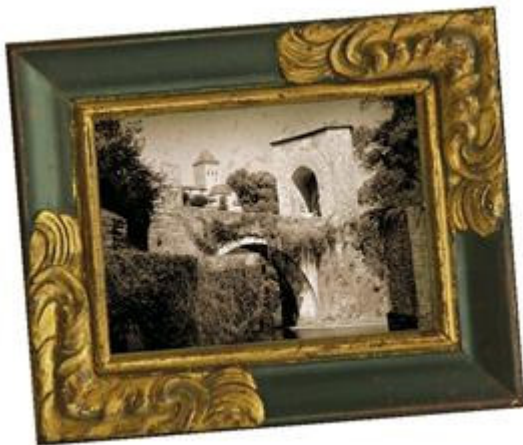
Chasse aux trésors à Sauveterre en Béarn des gaves