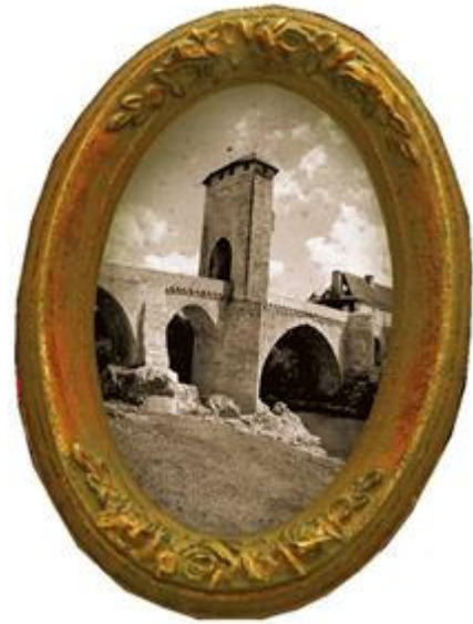
Chasse aux trésors à Orthez en Béarn des gaves